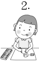
我最喜歡（圖畫／畫畫）。